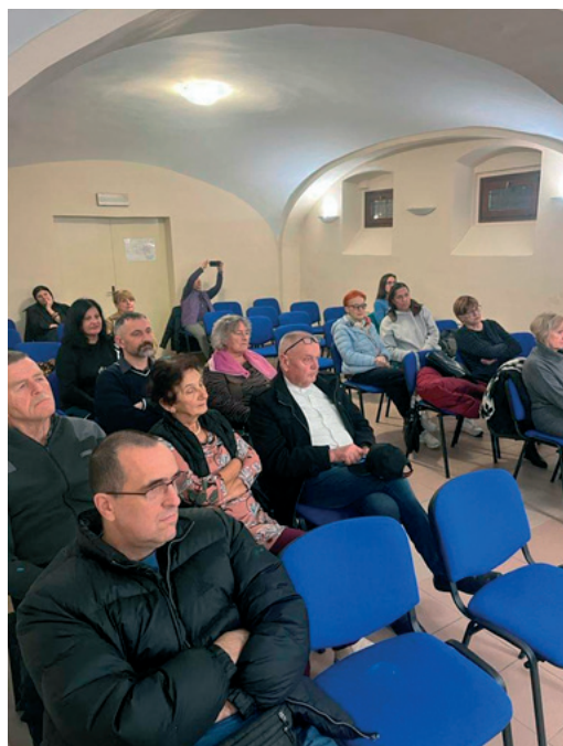
Promocija u knjižari Nova

đivanja prije nego što se shvati, te da ne postavlja pitanje prije nego što je posve siguran da zaista to što pita jest pitanje o biti stvari, ali i da ne smetne s uma kako će trebati prosuđivati o onome što knjiga sadrži. Uostalom još je Henri Lefbvre, taj poznati francuski intelektualac, filozof i sociolog, u svojoj Kritici svakidašnjeg života podsjetio da i čak prije ili poslije epskog momenta odluke i čina, treba suditi neprestano i uvijek. To je jedini čvrsti stav, jedini trajni zahtjev usred promjena, to je osovina života. Takav pristup čitanju ovog djela, tj. cijelo ovo djelo Nadie–Michal Brandl, izvlači tu bolnu tematiku Židova iz užih okvira zbivanja i s obzirom na širinu u promatranom razdoblju uopće stavlja ju, bezuvjetno, u mnogo širi kontekst.