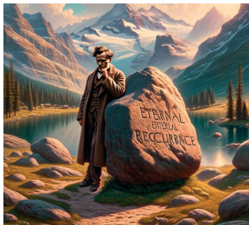
Ilustracija softvera na temu vječnog vraćanja

U hinduizmu, smatra se da je “sve već bilo”, odnosno, vrijeme je krug kojim teku događaji. Vrijeme je organizirano u yuge, odnosno faze s karakterističnim svojstvima. Postoje četiri yuge koje se stalno izmjenjuju kao četiri godišnja doba. Svaki ciklus traje preko četiri milijuna godina, a najkraća je kali yuga, u trajanju od oko 432 000 godina. Prema hinduističkom kalendaru, sada se svijet nalazi u kali-yugi, koja je započela 3102 g. pr. n. e., a koju karakteriziraju sukobi i ratovi. Hinduistički ciklus karakterizira stalna degradacija: prva yuga je