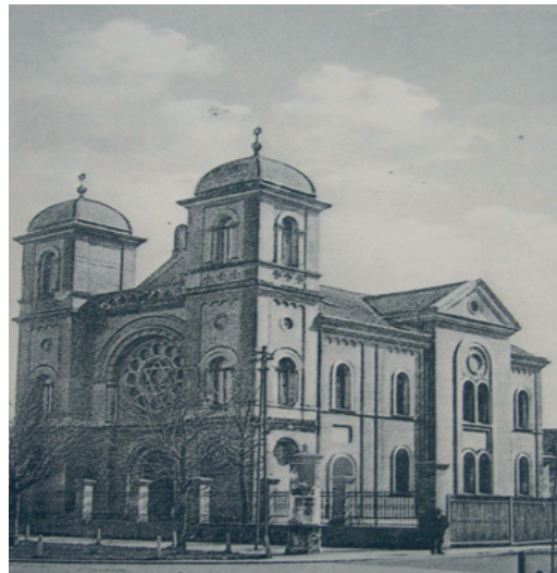
Synagogue in Slavonski Brod